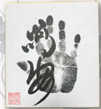
●力士直筆サイン例